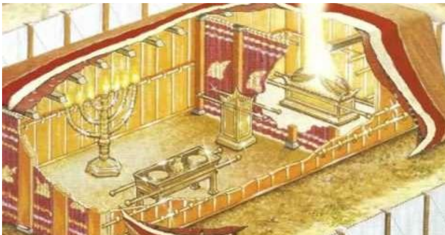
Slika 1 (Shodni šotor, svetovni splet 2020)

Izraelci so ga lahko nosili s seboj med potovanjem po puščavi. Bil je središče Izraelovega bogočastja, vse dokler ga ni nadomestil Salomonov tempelj.