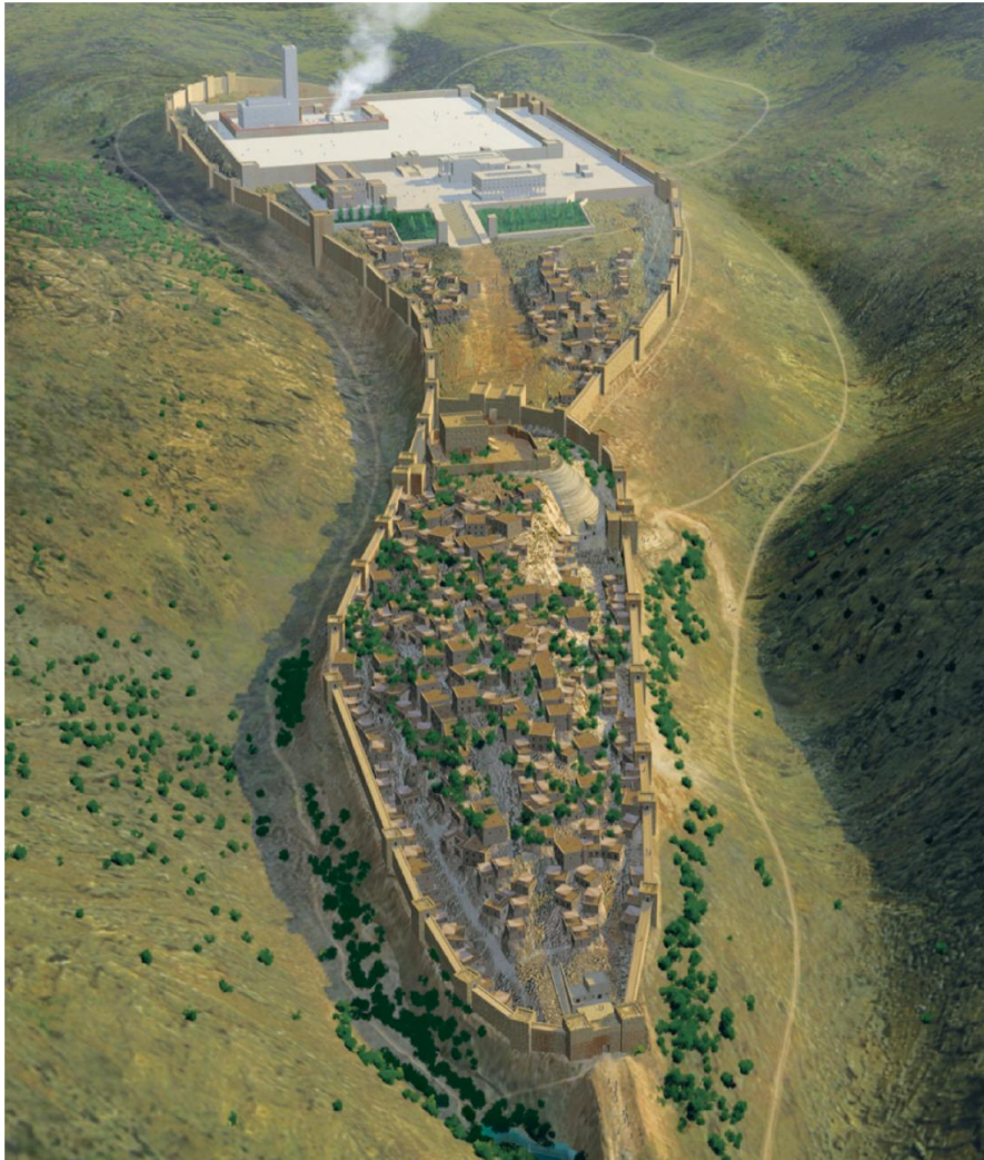
Slika 3 (Jeruzalem, svetovni splet 2020)

„Velik je GOSPOD in zelo hvaljen v mestu našega Boga, na njegovi sveti gori“ (Ps 48,2).