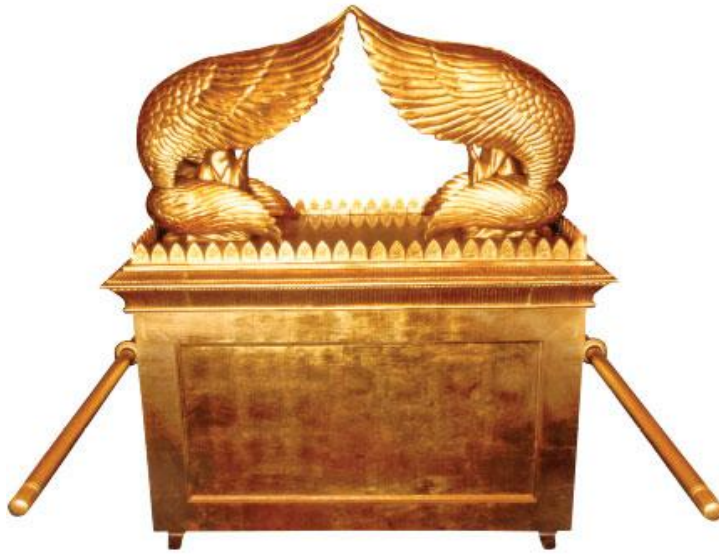
Slika 2 (Skrinja zaveze, svetovni splet 2020)

Skrinja zaveza je vodila Izrael po puščavi. Z njo so obhodili mesto Jeriho ob zavzetju. V bitki Izraela s Filistejci, so jo ti zajeli, toda povzročala jim je težave zato so jo vrnili nazaj.